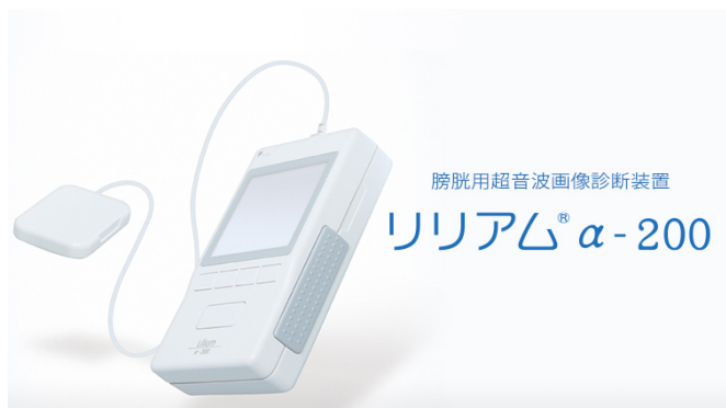
膀胱用超音波画像診断装置