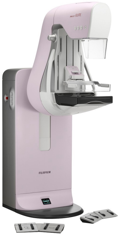
富士フイルムメディカル:AMULET ELITE